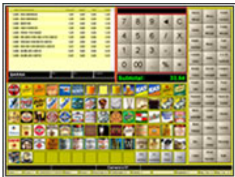
Programa para TPV Táctil

Le permitirá manejar toda la información de su establecimiento de una manera rápida, sencilla y eficaz. Todos los datos en pantalla muy fáciles de utilizar y comprender.